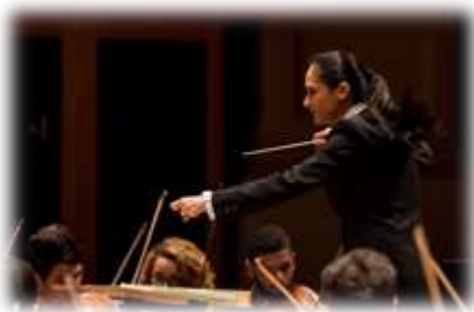
Simone Menezes, direction

Du côté des solistes, l'Orchestre Pasdeloup a également joué la carte de l'international en invitant de jeunes talents d'ici et d'ailleurs pour interpréter des pièces du grand répertoire – Sibelius, Fauré, Mahler, Gershwin... – comme des œuvres contemporaines.